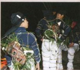
鬼役の子どもたち