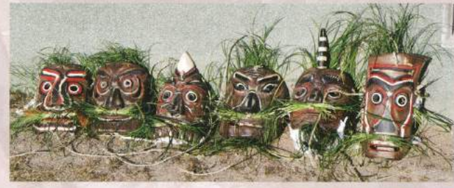
子供修正鬼会の面。上段は平成23年から使われているもの。下段はそれ以前に使われていたもの。

丸小野の子供修正鬼会でも鬼の役割は変わりません。子供鬼会では6人の鬼が登場し、松明をかざして参拝者を加持する「災払」を行います。さらに加持の輪に入れなかった参拝者のために「悪魔払」として、足元を松明であぶって無病息災を祈願します。