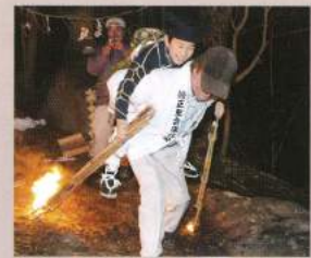
鬼を背負うタイレ

昔は、これらの役付になるのは座元地区の各家の長男だけで、次男以下や養子は参加できませんでした。