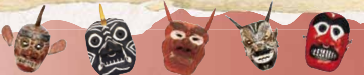
(日本遺産認定ストーリー原文)