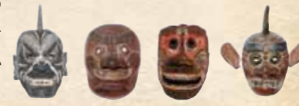
表情豊かな鬼会面

鬼会面の表情はバリエーションに富み、すごんだ顔だけではない。鬼会面をじっと見つめると、時には笑顔で、時には自慢げに、もしかしたら鬼のくせして目に涙を滲ませながら、里の昔話を聞かせてくれるかもしれない。