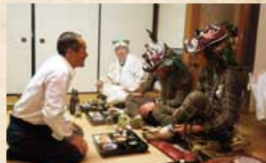
馴染みの鬼と盃を交わす(岩戸寺)

岩戸寺・成仏寺では、講堂での所作が終わると、鬼達は集落へと繰り出す。人々はこぞって鬼を自宅に招いてもてなし、鬼と酒を酌み交わす。「知らぬ仏より、馴染みの鬼」とはよく言ったもので、人々は年に1度の鬼と語らえるこの夜をこの上なく心待ちにしている。