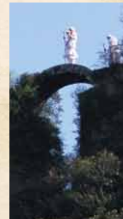
峯入りと無明橋(長岩屋)

鬼と人との深い友情の立役者となっているのが僧侶達である。鬼は古来より不思議な法力を持つ存在として、僧侶達の憧れの存在であった。古代仏教の僧侶達は、鬼の姿を探して「くにさき」の岩峰をよじ登り、鬼の棲む洞穴を削って「岩屋」と呼ばれる修行場を作り出し、岩屋を巡る「峯入り」を創始した。堂や社がなくても、霊窟の神仏に自然に手を合わせる、そんな仏教文化が「くにさき」では千年の歴史を持っている。岩屋の多くは「奥ノ院」と呼ばれて、いまでも各寺院の信仰のはじまりと位置づけられている。